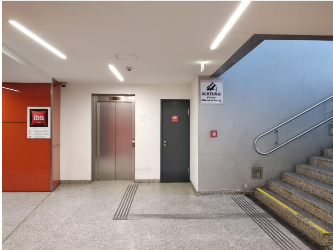
Foto 7: Aufzug 1 in der Hauptbahnhofunterführung, Ebene U1 (Garage, Zugang Hauptbahnhof)

Im 1. Stock steigen Sie aus Aufzug 1 aus und wenden sich nach links. Folgen Sie dem Gang bis Sie auf den nächsten Aufzug stoßen (Aufzug 2). Fahren Sie in den 3. Stock.