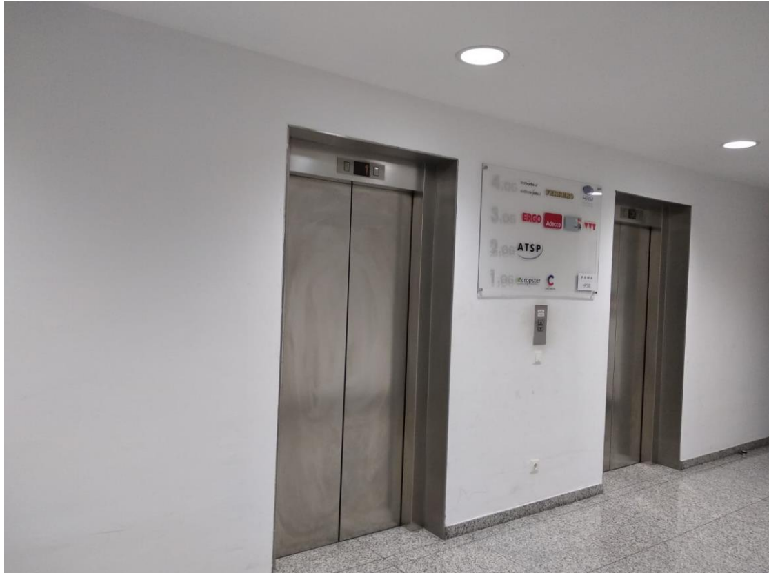
Foto 8: Aufzug 2 (es gibt 2 identische Aufzüge nebeneinander), diese befinden sich im 1. Stock (Sterzinger Straße 1, IBIS) und führen Sie in das 3.Stock, wo sie das VVT Büro befindet.