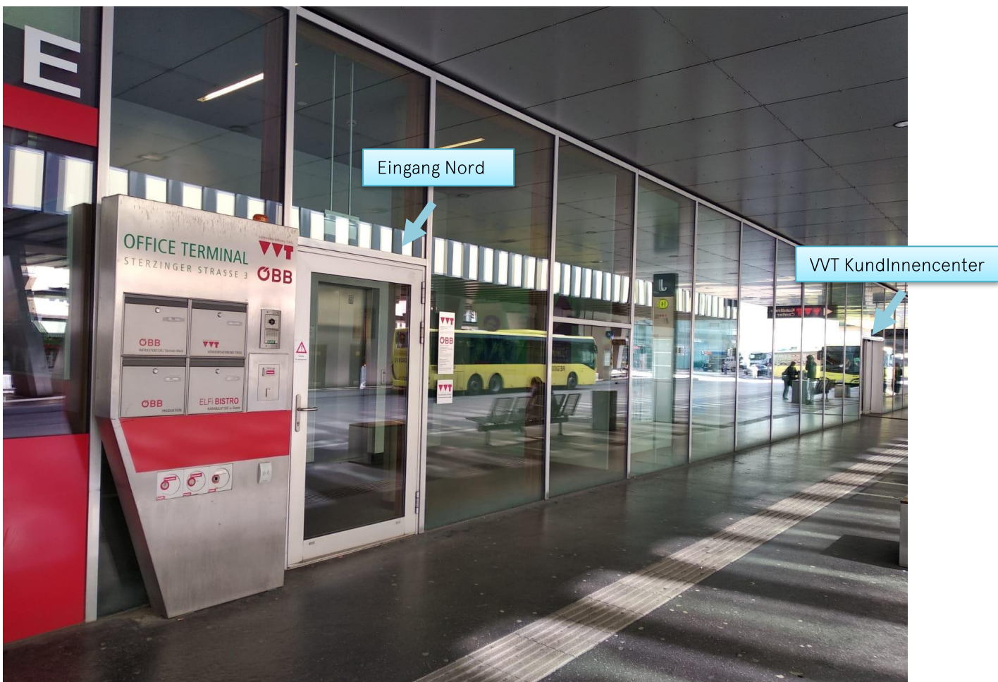
Foto 2: Eingangstür Nord in der Sterzinger Straße 3, das KundInnencenter befindet sich auf der rechten Seite. Die Büros des VVT befinden sich im 4.OG