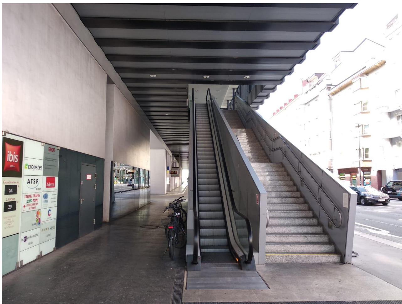
Foto 4: Sterzinger Straße 1, Treppe zum EG. Links – Rolltreppe nach oben

Die Treppe befindet sich an der Ampel gegenüber dem MPreis-Supermarkt (Salurner Straße 1). Für den Aufstieg ins Erdgeschoss steht eine Rolltreppe zur Verfügung. Nach dem Sie sich im 1. Stock befinden, erreichen Sie den 3. Stock (wo sich unser Büro befindet) mit einem Aufzug, der sich etwa 50 Meter von der Treppe entfernt befindet.