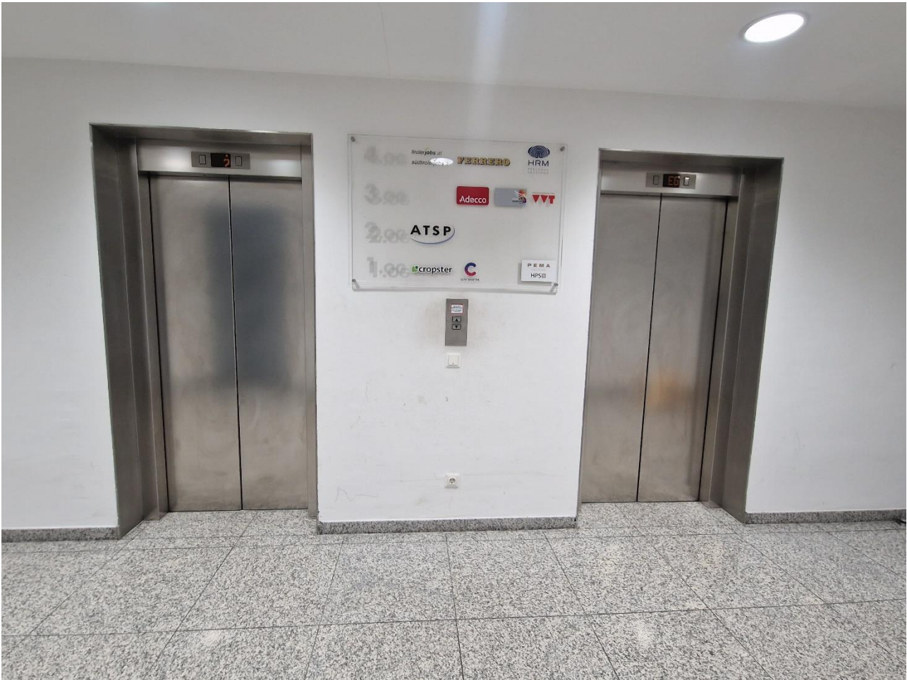
Foto 5: Aufzug 2 (es gibt 2 identische Aufzüge nebeneinander), diese befinden sich im 1. Stock (Sterzinger Straße 1, IBIS) und führen Sie in das 3.Stock, wo sich das VVT Büro befindet

Wenn Sie im 3. Stock aus dem Aufzug aussteigen, befindet sich unser Büro auf der rechten Seite. Um hineinzukommen, muss man klingeln.